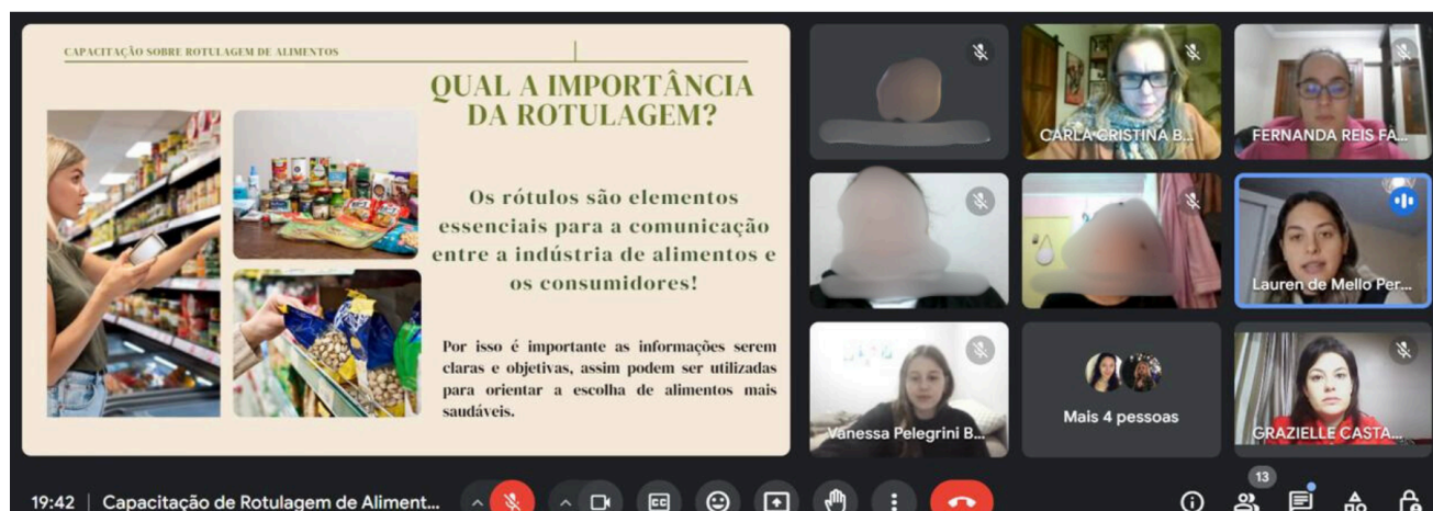
Figura 1 - Início da capacitação

Durante a capacitação, reforçou-se os elementos obrigatórios que compõem a rotulagem de alimentos, desde a identificação de origem, conteúdo líquido, lista de ingredientes, advertência de alergênicos, até o significado do valor diário de referência, entre outros. Além disso, essa atividade provou o quanto necessário é que ações de EAN com foco em rotulagem de alimentos sejam realizadas para a população geral, para que os indivíduos tenham maior conhecimento e autonomia acerca das suas escolhas alimentares.