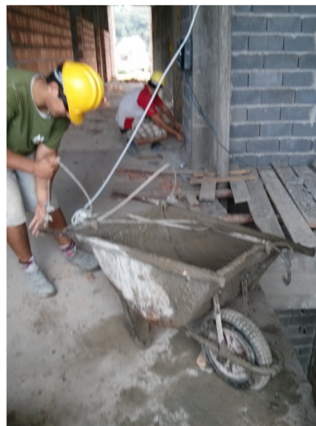
Figura 1. Produção das argamassas (a) Içamento do carrinho de mão (b).